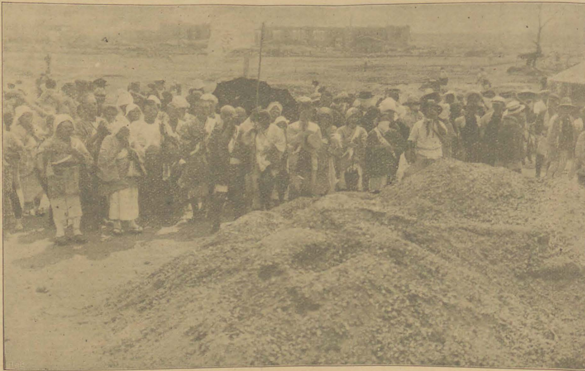
DE ASCH VAN EEN 30.000 VERKOOLDE SLACHTOFFERS VAN DE RAMP IN JAPAN.

Japansche vrouwen zijn bijzonder huiselijk aangelegd. Zij zijn opgewekt, huishoudelijk, zuinig en kunnen uitstekend met de naald omgaan. Zeer zelden ziet men een haveloos kind; de kleeren worden gelapt en gelapt, totdat men bijna niet meer kan zeggen, wat het origineel en wat de lap is. Vrouwen van andere landen